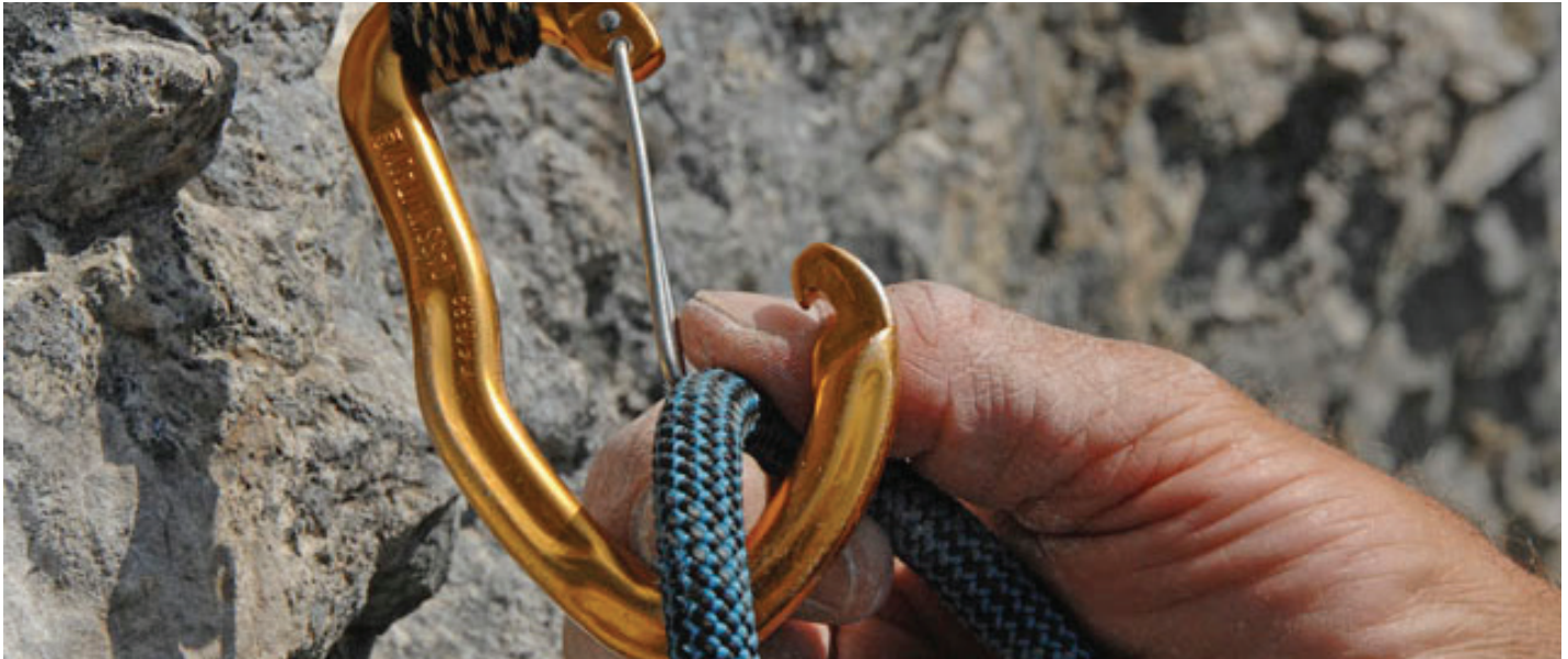
Optimal geeignet für Ausbildung im Fels mit Seil & Karabiner...