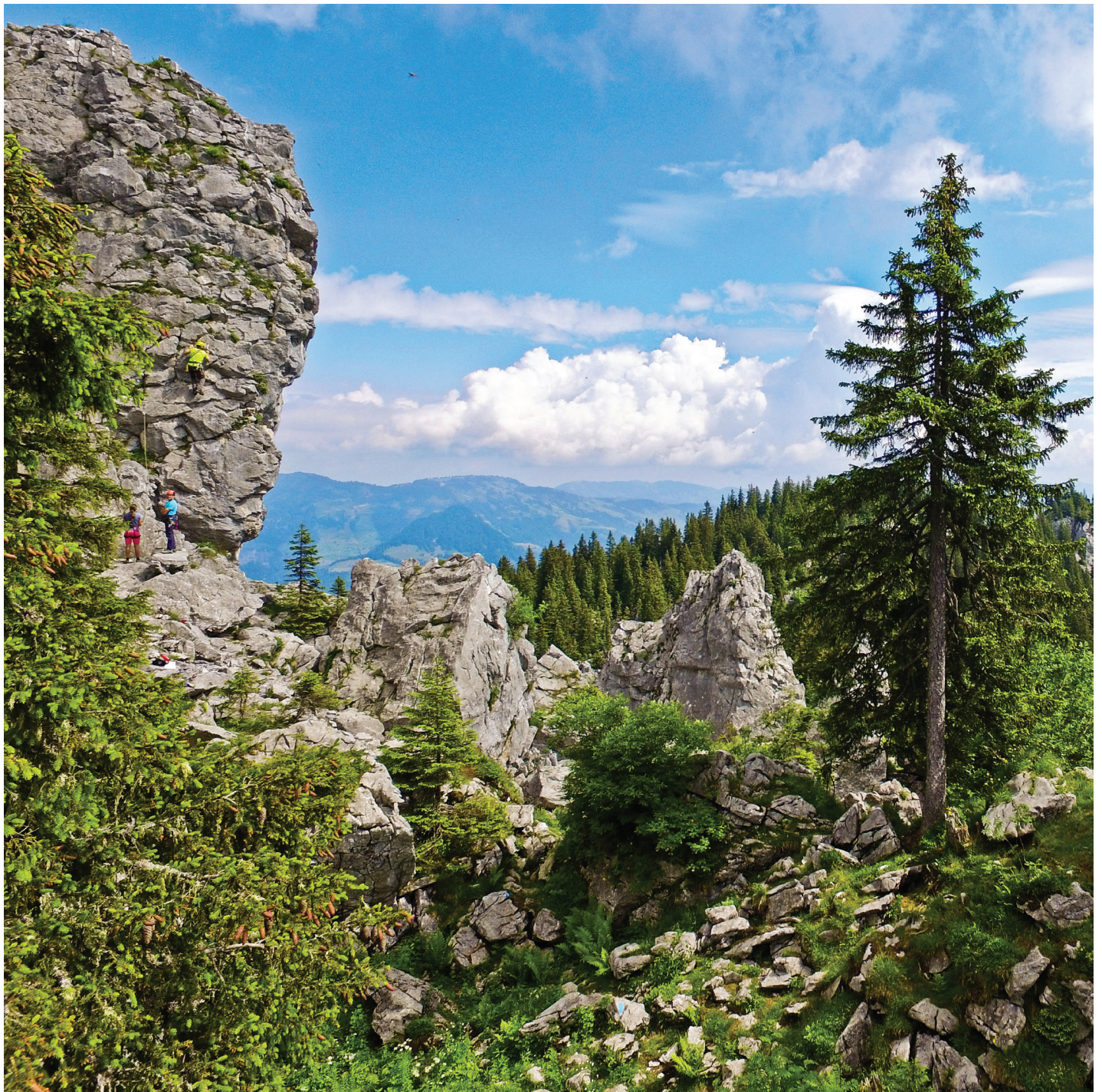
Die schönen Kalktürme im Sektor A, Klettergarten Ärgglen, Klewenalp