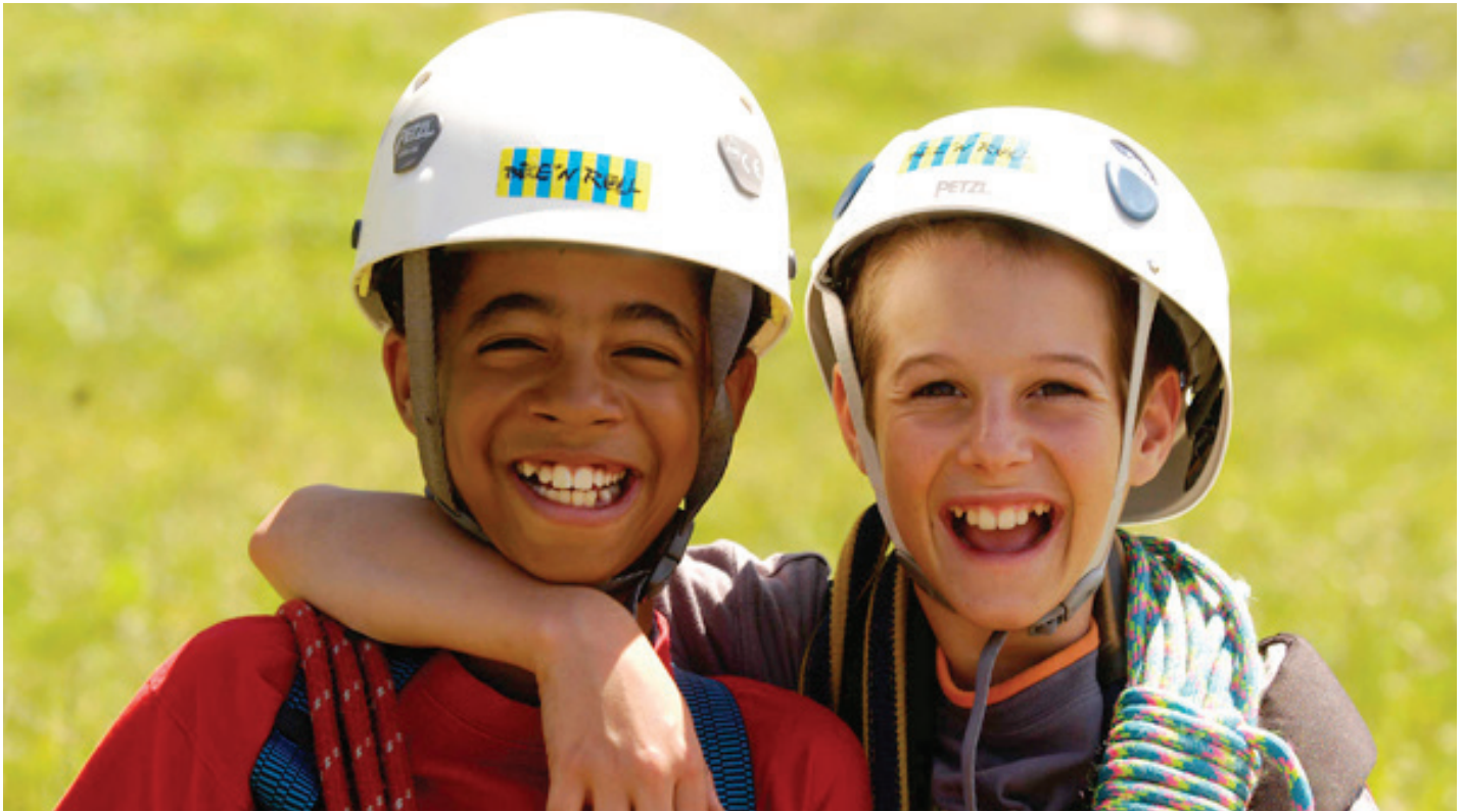
Viel Spass am Klettern für die ganze Familie!